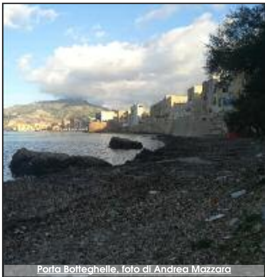
Porta Botteghelle

Continua il mio viaggio fra le rimembranze di una Trapani che fu. Fortunatamente amo fare lunghe passeggiate e queste mi consentono di notare ciò che, chi ne è preposto, spesso non viene osservato da chi va di fretta (o non ha a cuore il territorio).